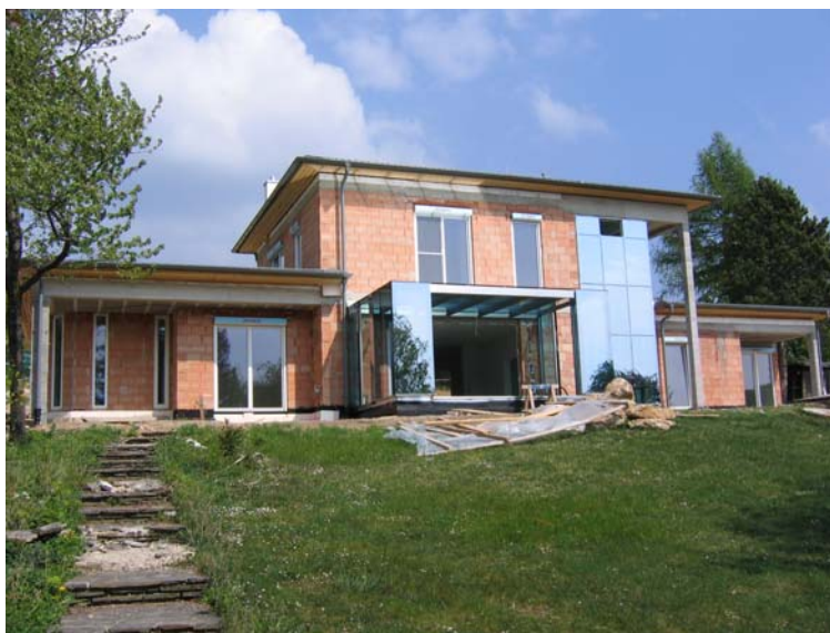
Foto: Einfamilienhaus mit Stiegenhausverglasung und Wintergarten

Ein Zu- und Ausbau des Gebäudes war rasch überlegt, eine Kosten-Nutzen-Analyse zeigte schließlich auch, dass das Entfernen des bestehenden Bungalows und eine gänzliche Neuerrichtung weit einfacher und auch kostengünstiger ist.