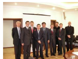
Das österreichische Experten Team mit ihren Auftraggebern