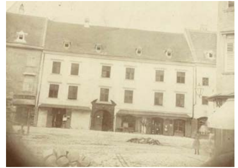
Alte Ansicht des „Siegl-Hauses“

Diese Besonderheit wurde wissenschaftlich dokumentiert und „gesichert“.