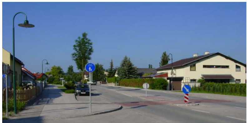
Foto: B11 in Gaaden nach Straßenumbau